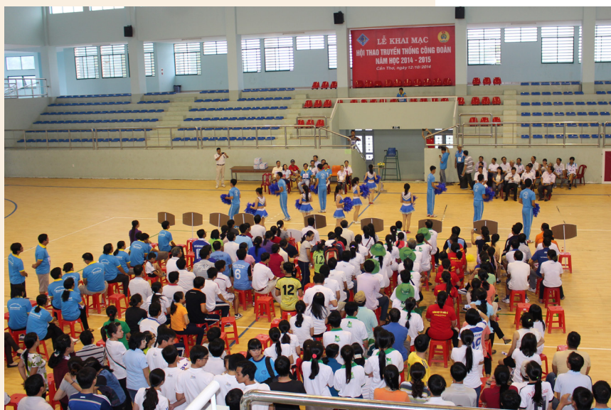
Lễ Khai mạc Hội thao truyền thống Công đoàn Trường năm học 2014-2015 diễn ra tại Nhà Thi đấu Thể dục thể thao.