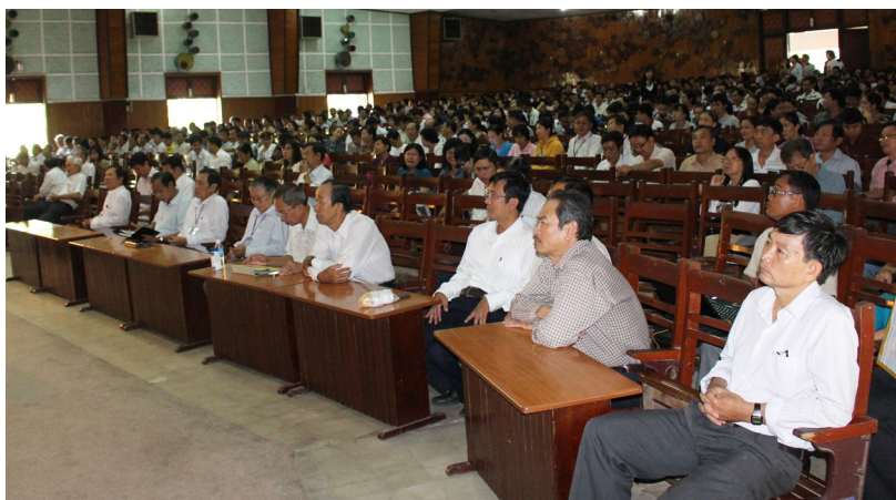
CCVC, sinh viên, học sinh của Trường chăm chú theo dõi trong buổi sinh hoạt.

Tại buổi sinh hoạt, CCVC, sinh viên, học sinh của Trường cũng được quán triệt quan điểm chỉ đạo của Đảng và Nhà nước về tinh thần đoàn kết, phát huy sức mạnh của toàn Đảng, toàn dân qua những việc làm thiết thực, đúng đắn, góp phần xây dựng và bảo vệ tổ quốc, bảo vệ chủ quyền biển, đảo Việt Nam; chung sức, chung lòng, đoàn kết toàn dân giữ vững an ninh chính trị, xây dựng và phát triển kinh tế xã hội, đưa nước ta tiến lên, cùng sánh vai với bạn bè quốc tế. Qua đó, CCVC, sinh viên, học sinh của Trường tiếp tục nêu cao tinh thần hướng về biển đảo quê hương; thi đua dạy tốt, học tốt; tiếp tục hỗ trợ và ủng hộ tinh thần các chiến sĩ và ngư dân đang thực hiện nhiệm vụ bảo vệ chủ quyền biển đảo của Tổ quốc và xây dựng kinh tế biển, góp phần làm giàu cho đất nước.