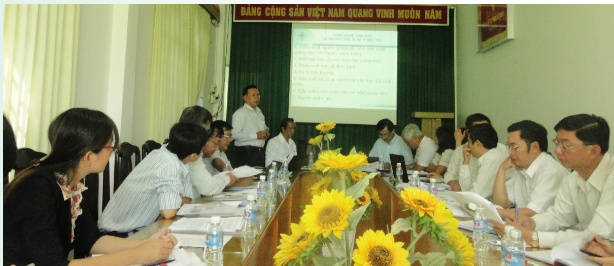
Toàn cảnh buổi thảo luận giữa Sở Khoa học và Công nghệ Bến Tre và Trường ĐHTC.

Nhằm chuẩn bị nội dung hợp tác phát triển giữa Ủy ban nhân dân tỉnh Bến Tre và Trường Đại học Cần Thơ (ĐHTC) về Đề án tái cơ cấu nông nghiệp (TCCNN) của tỉnh, ngày 22/10/2014, Trường ĐHTC đã có buổi làm việc với Sở Khoa học và Công nghệ (KH&CN) tỉnh Bến Tre.