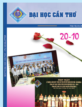
Ảnh bìa 1: Kỷ niệm ngày 20/10