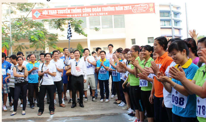
Chuẩn bị! Xuất phát!

qua, sau phần khai mạc Hội thao là phần tham gia thi đấu mở màn với môn Đi bộ thể thao được phân chia theo nhiều nhóm tuổi (1.500m nam, độ tuổi \leq 40 và > 40 tuổi; 800m nữ, độ tuổi \leq 35 tuổi và > 35 tuổi). Đặc biệt, góp phần tạo nên bầu không khí sôi nổi, hào hứng của chương trình khai mạc, Ban Tổ chức Hội thao đã trao thưởng cho các VĐV đạt giải môn Đi bộ thể thao ngay sau khi kết thúc môn thi với khoảng 60 giải thưởng, gồm các giải Nhất, Nhì, Ba, Khuyến khích và giải Đặc biệt dành cho các đơn vị có lãnh đạo Đảng, chính quyền, đoàn thể tham gia đông đủ nhất.