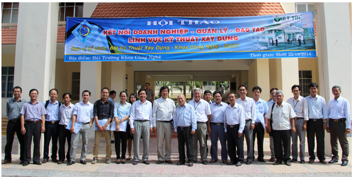
Ảnh lưu niệm tại Hội thảo.

Tại Hội thảo, các đại biểu cũng đã chia sẻ tham luận về những kết quả nghiên cứu khoa học, những công nghệ ứng dụng trong xây dựng thuộc các lĩnh vực khác nhau như: địa kỹ thuật xây dựng; kết cấu bê tông công trình, công nghệ vật liệu xây dựng; kiến trúc, qui hoạch, giao thông và thủy lợi. Từ đó, các đại biểu đã cùng thảo luận nhằm xác định khả năng ứng dụng của những thành tựu khoa học công nghệ liên quan trong điều kiện xây dựng các công trình vùng ĐBSCL, hướng đến hiệu quả cao về mặt kinh tế xã hội cho các công trình.