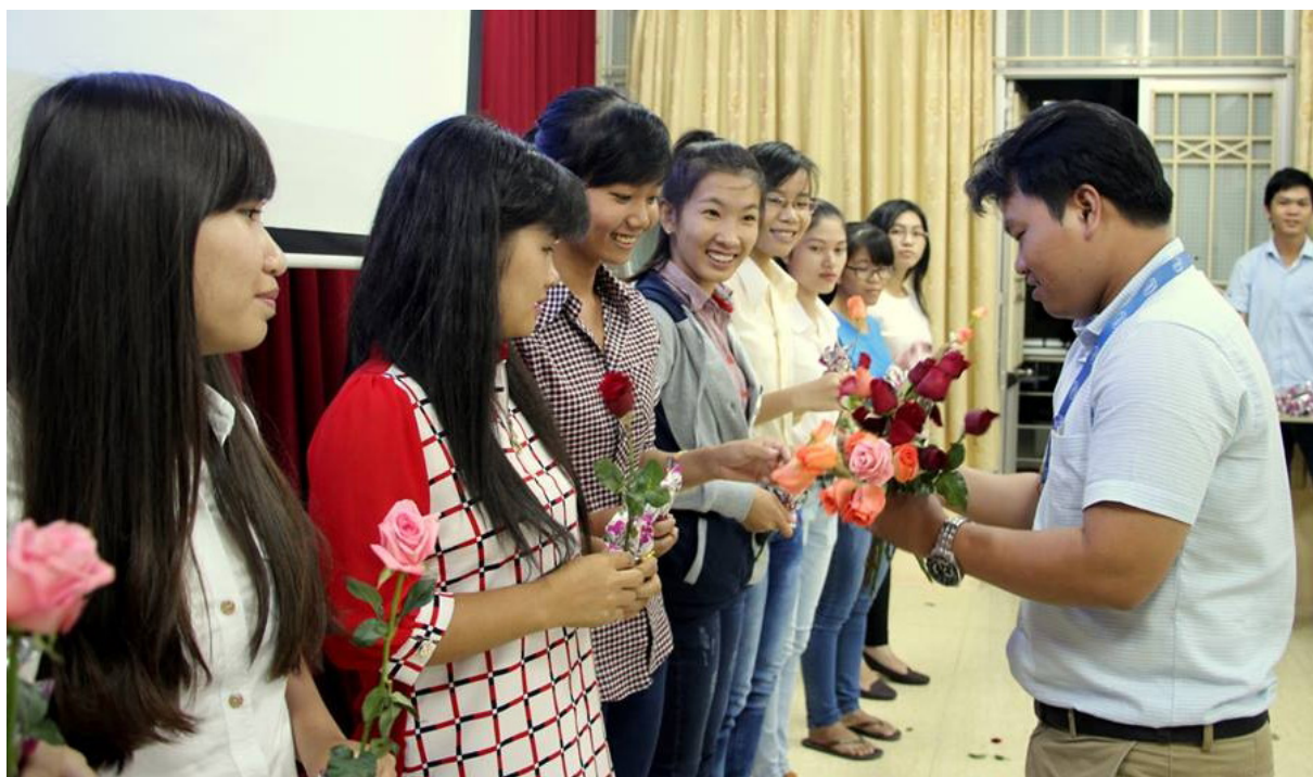
Các bạn nữ được tặng hoa trong ngày 20/10.

Hòa trong không khí ấy, Khoa Công nghệ-Trường Đại học Cần Thơ đã tổ chức buổi họp mặt Câu lạc bộ Nữ sinh để ôn lại truyền thống ngày thành lập Hội Liên hiệp Phụ nữ Việt Nam và ngày Phụ nữ Việt Nam 20/10, bên cạnh tạo cơ hội cho các bạn sinh viên cùng gặp gỡ, trao đổi trong không khí vui tươi và lành mạnh.