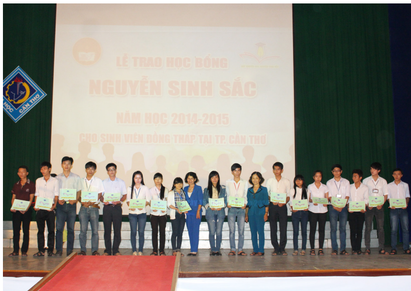
Trao học bổng cho sinh viên.

Sáng ngày 18/10/2014, Lễ trao học bổng Nguyễn Sinh Sắc năm học 2014-2015 của Hội Khuyến học tỉnh Đồng Tháp dành cho sinh viên Đồng Tháp đang học tập tại các trường đại học, cao đẳng khu vực Đồng bằng sông Cửu Long (ĐBSCL) đã diễn ra tại Hội trường Lớn-Trường Đại học Cần Thơ (ĐHCT).