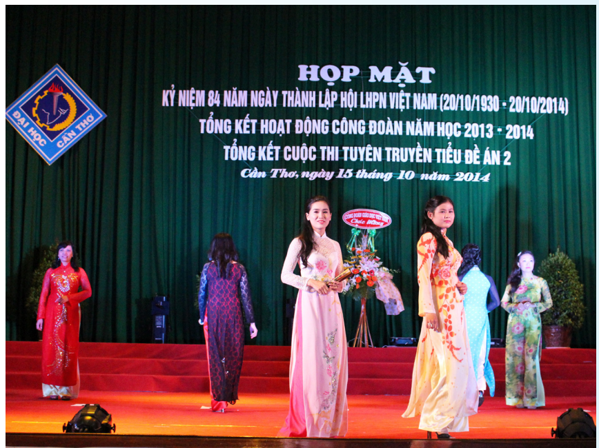
Biểu diễn thời trang của CCVC Trường mừng họp mặt kỷ niệm ngày thành lập Hội Liên hiệp Phụ nữ Việt Nam 20/10.

Tổng kết trao giải, Công đoàn Trường đã trao 19 giải thưởng cho sinh viên, trong đó có 01 giải Nhất, 01 giải Nhì, 02 giải Ba; 19 giải thưởng cho CCVC với 01 giải Nhất, 01 giải Nhì, 02 giải Ba. Kết quả vòng chung kết tập thể CCVC, Công đoàn Trường đã trao 06 giải thưởng cho các đội: 01 giải Nhất (Khoa Nông nghiệp và Sinh học Ứng dụng); 01 giải Nhì (Trung tâm Công nghệ phần mềm); 02 giải ba (Khoa Sư phạm và Khoa Sau đại học) và 02 giải khuyến khích (Trung tâm Liên kết Đào tạo và Phòng Quản trị Thiết bị).