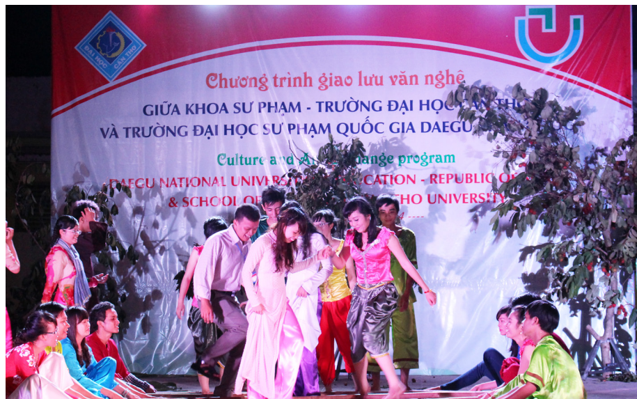
Giao lưu giữa Khoa Sư phạm-Trường Đại học Cần Thơ và Trường Đại học Sư phạm Quốc gia Daegu (Hàn Quốc) vào tháng 8/2014.

Nhìn chung, các chương trình hợp tác quốc tế của Khoa đã góp phần nâng cao vai trò, vị trí của Khoa với các đối tác Úc, Pháp, các Trường trong khu vực Đông Nam Á, Hàn Quốc, Nhật Bản đồng thời thể hiện vai trò của Khoa trong việc hỗ trợ phát triển năng lực chuyên môn cho